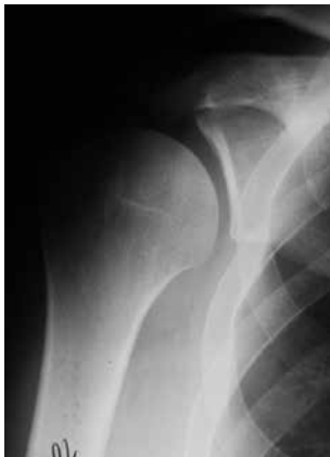
1. Røntgenbillede af normal skulder.

Ofte vil det være tilstrækkeligt alene at udskifte ledhovedet (Hemi-alloplastik), hvilket er en noget mindre operation.