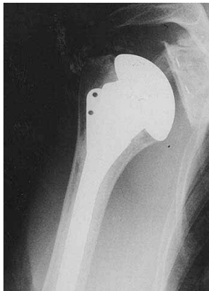
4. Røntgenbillede og led-skål.