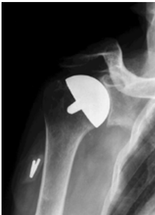
3. Røntgenbillede af Cap protese af protese med skaft.

Ved begge disse operationer må man ind imellem også anvende en protesedel til udskiftning af ledskålen på skulderbladet, hvis denne er nedslidt og deformeret. Denne protesedel er som regel af plastik (Polyethylen) (Figur 4).