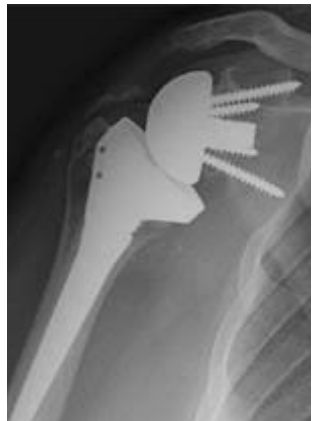
5. Røntgenbillede af Revers-type protese (venstre skulder).

Endelig kan der være tale om at anvende en "omvendt" protese (Revers-type), hvis skulderen er ustabil som følge af manglende styresener (Rotatorcuff). Halvkuglen, som man sætter fast på ledskålen gør ledet meget stabilt. Ledskålen sættes fast i overarmsknoglen med cement. (Figur 5)