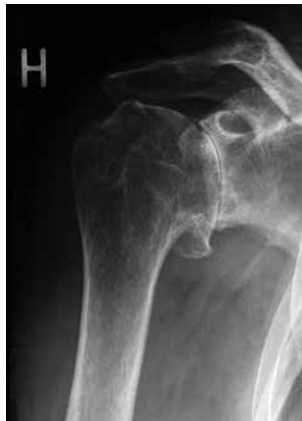
2. Røntgenbillede af skulder med slidgigt.

Målet med operationen er at lindre eller helt at fjerne smerterne. Man vil ikke altid kunne påregne fuld bevægelighed efter operationen, specielt ikke hvis der har været bevægeindskrænkning i længere tid før operationen. Dog vil bevægeligheden i nogle tilfælde blive bedre end før operationen, fordi smerterne forsvinder.